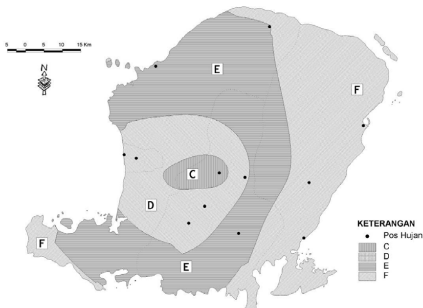
Gambar 3. Peta Agroklimat Pulau Lombok klasifikasi Schimidt-Ferguson tahun 1951

Lombok. Klasifikasi iklim yang dilakukan oleh Schmidt-Ferguson tidak dilengkapi dengan peta sehingga dibuatlah peta zone Agroklimat (Gambar 3). Berdasarkan peta yang dibuat dengan memanfaatkan Sistem Informasi Geografi terlihat sebaran dari zona-zona agroklimat. Hasil analisis menunjukkan bahwa Tipe C mempunyai luasan sebesar 12922.019 ha (2.774%), Tipe D seluas 89470.466 ha (19.204%), Tipe E seluas 202005.398 ha (43.360%), dan Tipe F seluas 161483.879 ha (34.662%).