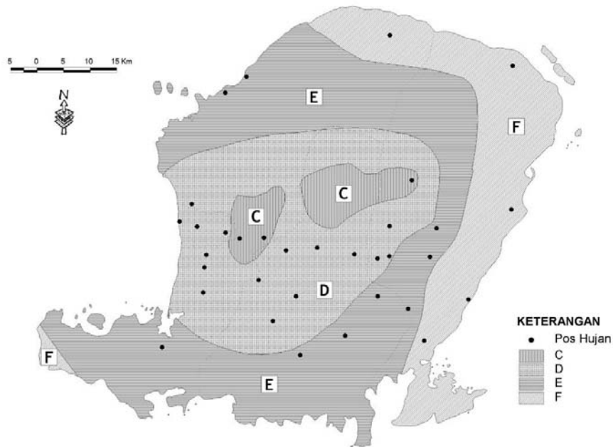
Gambar 4. Peta Agroklimat Pulau Lombok klasifikasi Schimidt-Ferguson hasil evaluasi

Hasil evaluasi Peta agroklimat pulau lombok klasifikasi Schmidt-Ferguson memperlihatkan bahwa daerah-daerah yang tergolong bertipe basah yaitu tipe iklim C terdapat di bagian selatan dan barat daya kaki Gunung Rinjani. Daerah yang tergolong bertipe kering yaitu tipe iklim F terdapat di pulau Lombok bagian timur dan sebagian kecil di barat daya Pulau Lombok. Sedangkan untuk tipe iklim D dan E membentuk sabuk terhadap Gunung Rinjani sampai di Pantai Selatan, Pantai Barat serta Pantai Utara Pulau Lombok