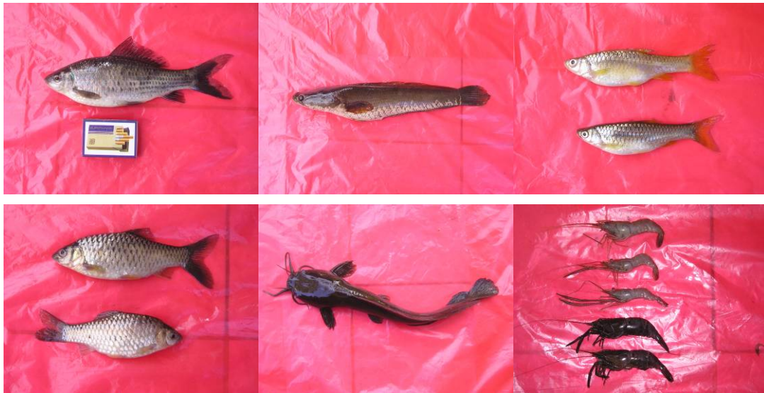
Gambar 6. 4 Keanekaragaman sumberdaya ikan dan udang air tawar di Kota Denpasar : Ikan Nilem ( Osteochilus hasselti ), Gabus ( Ophicephalus striatus ), Masan ( Rasbora spp ). Lele ( Chlarias batrachus ) dan udang (Restu, 2004).

Karena tidak adanya aliran permanen dari sungai ( river run off ), yang disinyalimen memberikan ( suplies ) bahan organik detritus dan zat hara, menyebabkan produktivitas perairan di kawasan tersebut tergolong rendah. Rendahnya produktivitas primer dan sekunder di perairan ini berdampak pada struktur komunitas ikan di wilayah hutan, dimana hanya didukung oleh 37 species. Kelimpahan ikan di kawasan ini tergolong paling rendah yaitu 396 ekor per area sampling. Disamping itu keanekaragaman komunitas ikan air tawar di Kota Denpasar cukup tinggi. Beberapa contoh specimen ikan air tawar disajikan pada Gambar 6.4