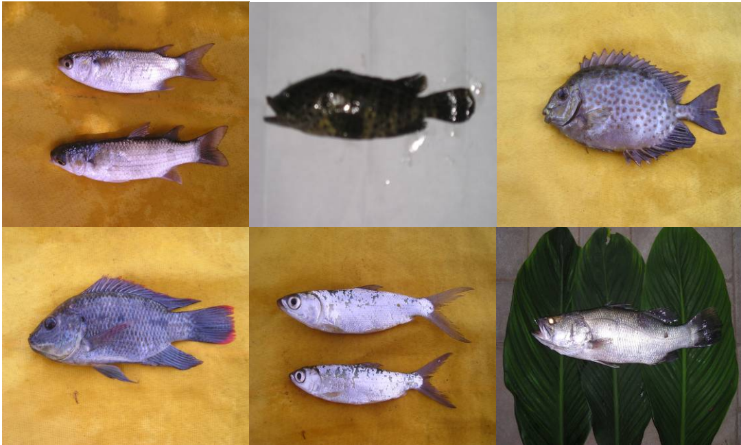
Gambar 6.3 Beboso ( Acentrogobius ) dan Belodok ( Periophthalmus ) serta Mujair ( Oreochromis mossambicus )

tentang fungsi dan kegunaan dari sumberdaya ini. Sementara itu di perairan Pantai Serangan Denpasar ditemukan 7 jenis lamun dan spesies yang paling mendominasi adalah Thalassia hemprichii (Linawati, 2005).